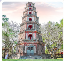
วัดเทียนมู่