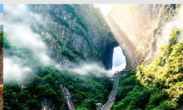
ประตูลววจจรค