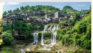
หมู่บ้านโบราณผู่หลงเจิน

*ทางบริษัทฯ ขอสงวนสิทธิ์ในการสลับโปรแกรมทัวร์ตามความเหมาะสมขึ้นอยู่กับสถานการณ์หน้างาน โดยคำนึงถึงผลประโยชน์ของลูกค้าเป็นสำคัญ