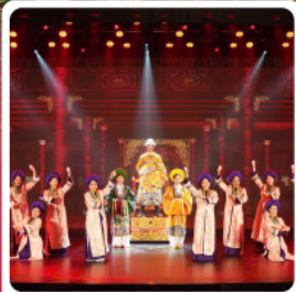
The Heritage Show