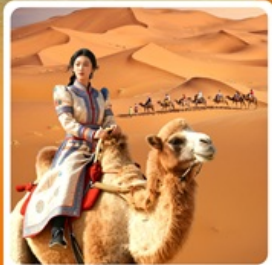
ซี่อูซูชมทะเลทราย

• โฮเทล เป็นทรายเป็นชาวาน แพล่งท่องเที่ยวระดับ 5A ของจีน แกรนด์แคนยอนแม่น้ำเหลือง ซี่อูซูท่ามกลางทะเลทราย