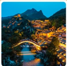
หุบเขาวังเซียนกู่