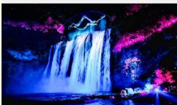
อุทยานน้ำตกหวงกั๋วซู่