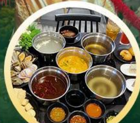
ซาบูฮ่องกง

02-04 มิ.ย. 18-20 มิ.ย. 07-09 มิ.ย. 20-22 มิ.ย. 13-15 มิ.ย. 25-27 มิ.ย. 14-16 มิ.ย. 28-30 มิ.ย.