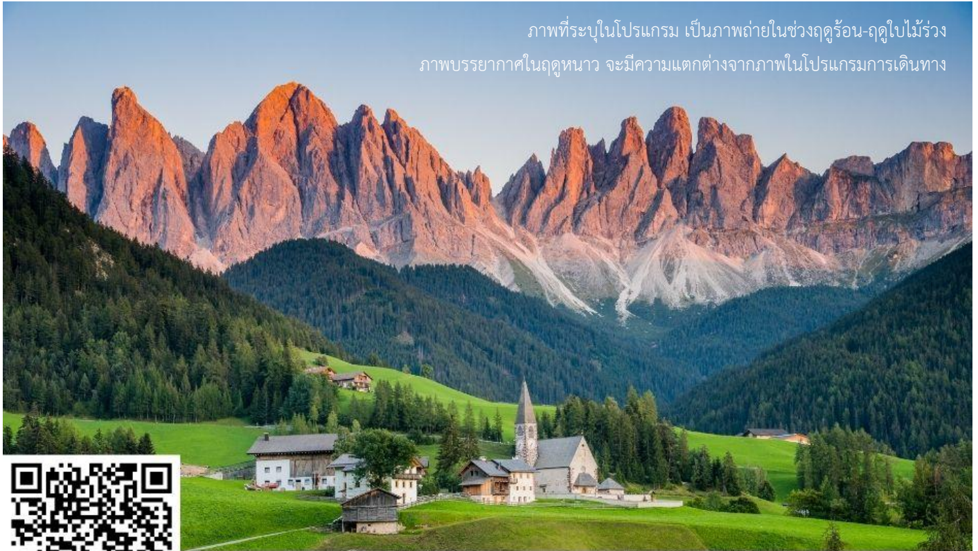
ภาพที่ระบุในโปรแกรม เป็นภาพถ่ายในช่วงฤดูร้อน-ฤดูใบไม้ร่วง ภาพบรรยากาศในฤดูหนาว จะมีความแตกต่างจากภาพในโปรแกรมการเดินทาง

จากนั้นนำท่านเดินทางสู่ ชุมชน Val di Funes ชุมชนเล็กๆ ทางภาคตะวันตกของอุทยานโดโลไมต์ ประกอบด้วยหมู่บ้านเล็กๆ 6 หมู่บ้าน โดยมีชื่อเสียงจากการมีวิวทิวทัศน์ที่สวยงามที่สุดในเขต South Tyrol อีสระให้ท่านเก็บภาพความประทับใจ จากนั้นนำท่านเก็บภาพความประทับใจอีกหนึ่งสถานที่ ณ โบสถ์ Santa Maddalena โบสถ์ที่ถือเป็นสถานที่ไฮไลท์ที่ถูกต้องมากที่สุดอุทยานโดโลไมต์ มีวิวทิวทัศน์ที่สวยงามมีฉากหลังเป็นเทือกเขา Odles (การเดินทางขึ้นไปเก็บภาพความประทับใจนี้ ท่านจะต้องเดินขึ้นลงเนินไปและกลับประมาณ 2 กิโลเมตร เพื่อไปเก็บภาพ)