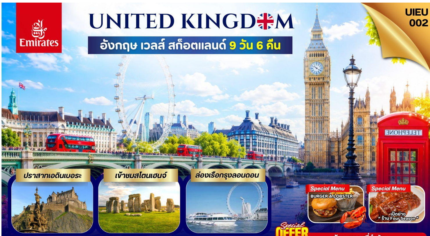
ปราสาทเอดินบะระ