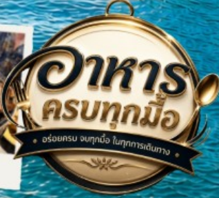
ปิ้งย่าง