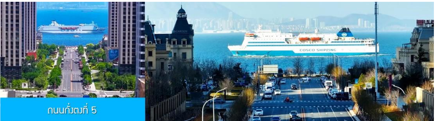
ถนนกั๋วทงที่ 5

จากนั้นนำท่านเที่ยวชม สวนน้ำเมืองเวนิสตะวันออก 大连东方威尼斯城 เป็นเมืองเวนิสจำลองที่ถูกสร้างขึ้นด้วยทุนกว่า 8,000 ล้านบาท ออกแบบโดยบริษัท ARC จากประเทศฝรั่งเศส โดยจำลองผังเมืองเวนิสในประเทศอิตาลี บนพื้นที่กว่า 400,000 ตารางเมตร ประกอบด้วยคลองเวนิสและอาคารที่มีสถาปัตยกรรมแบบตะวันตกกว่า 200 หลัง มีบริการล่องเรือคอนโดล่าแก่นักท่องเที่ยว นำท่านเดินชม ถ่ายภาพที่ระลึกท่ามกลาง