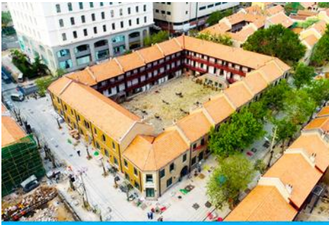
เมืองเก่าเยอรมัน ตรอกกว้างชิงลี่