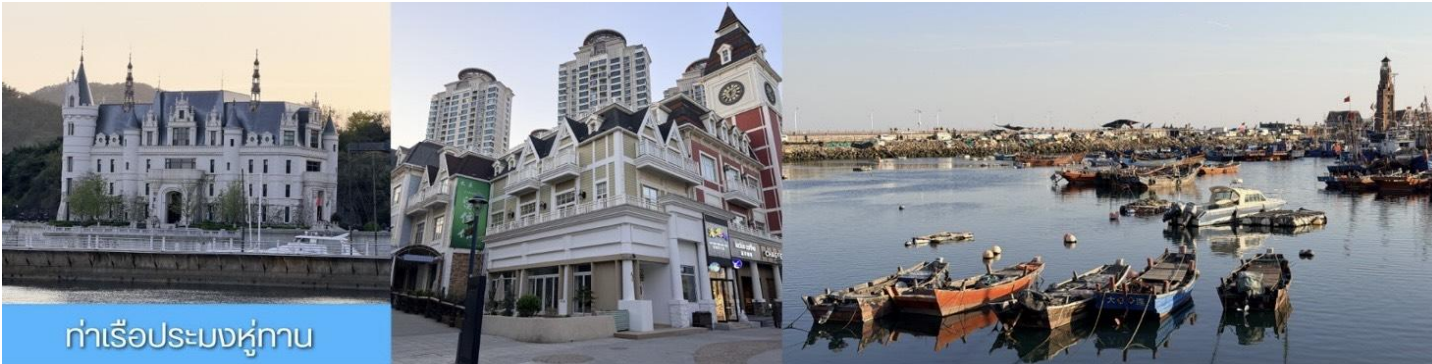
ท่าเรือประมงหู่กาน

พักที่ DALIAN JUZISHUIJING HOTEL หรือ โรงแรมระดับ 4 ดาวท้องถิ่น เมืองต้าเหลียน