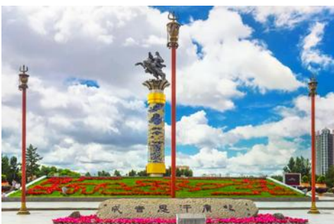
จัตุรัสเวงกิสข่าน

หลังอาหารนำท่านเดินทางสู่เมือง ไห่ลาเอ๋อ 海拉尔市 (ระยะทาง 456 กม. ใช้เวลาเดินทางราว 5 ชั่วโมงครึ่ง)