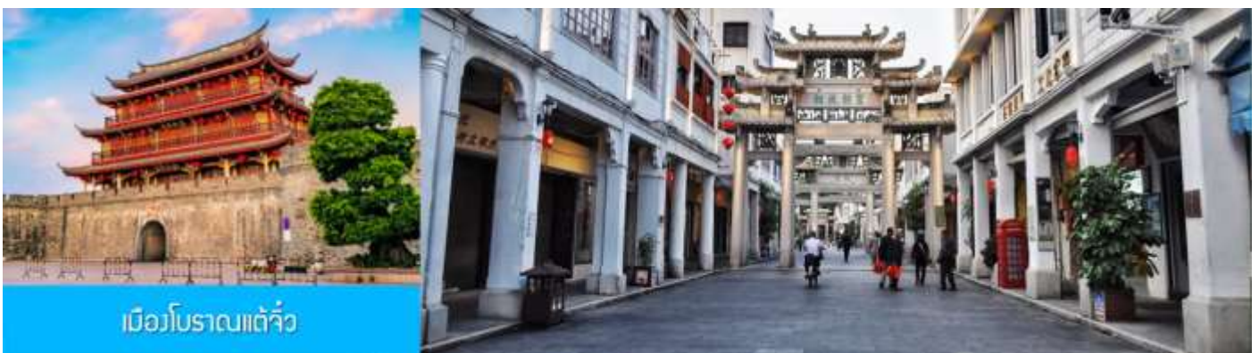
เมืองโบราณเต้จิ๋ว

พักที่ โรงแรม HAKKA TULOU PRINCE HOTEL 4* หรือเทียบเท่าในเมืองหย่งตั้ง