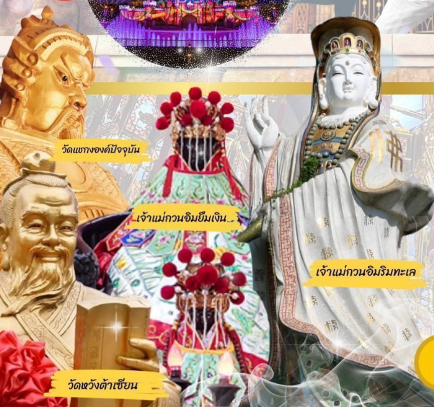
วัดแห่งองค์ปัจจุบัน