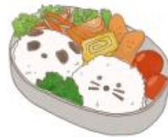
● อาหารสำหรับเด็ก ( 2-11 ปี ) *วัตถุประสงค์ขึ้นอยู่กับทิวทัศน์