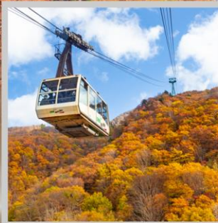
“ZAO CHUO ROPEWAY”