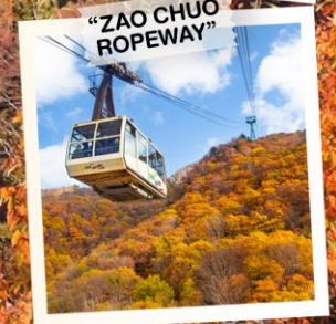
"ZAO CHUO ROPEWAY"

วันเดินทาง 30 ต.ค. - 5 พ.ย. 2569 4 - 10 พ.ย. 2569