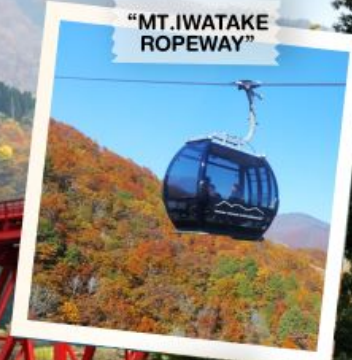
"MT. IWATAKE ROPEWAY"