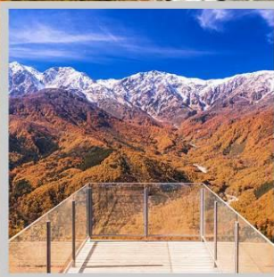
“HAKUBA MT. HARBOR”