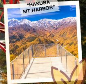
"HAKUBA MT. HARBOR"

วันเดินทาง 28 ต.ค. - 3 พ.ย. 2569 4 - 10 , 11 - 17 พ.ย. 2569