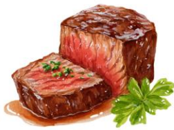
● ไม่ทานเนื้อวัว

ขอความกรุณาแจ้งวัตถุประสงค์ที่ท่าน แพ้หรือไม่สามารถรับประทานได้