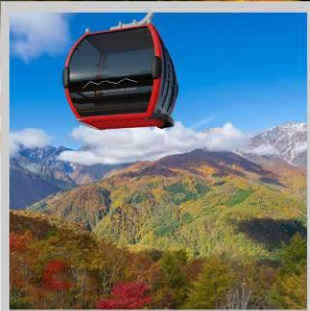
“MT. IWATAKE ROPEWAY”