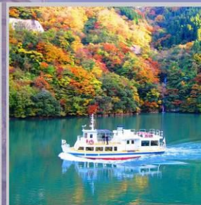
"SHOGAWA YURAN CRUISE"