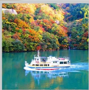
“SHOGAWA YURAN CRUISE”