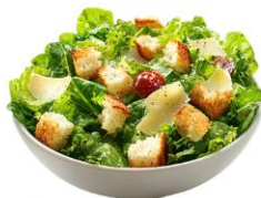
● ผักสดวิธีตี