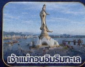
เจ้าแม่ทวนอิมริมทะเล