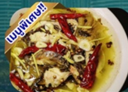
ปลาต้มผักกาดดอง