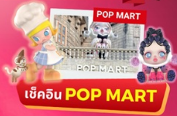
เช็คอิน POP MART