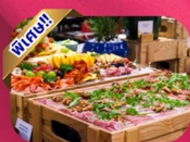
Buffet Dinner Banahill