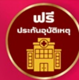
ฟรีประกันอุบัติเหตุ