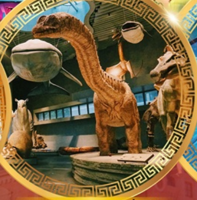
พิพิธภัณฑ์ธรรมชาติเซี่ยงไฮ้