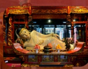
สักการะวัดพระหยกขาว