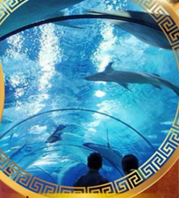
เซี่ยงไฮ้อาเซียนอะควาเรียม