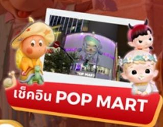
เช็คอิน POP MART