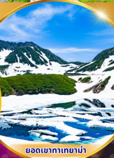
ยอดเขาทาเกยาม่า

พักรูแรม 3 ดาว ★★★★★ ฟรี ประกันอุบัติเหตุ บริการอาหารท้องถิ่น