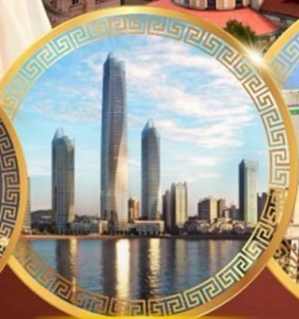
ชมวิวดาคารไฮตัน เซ็นเตอร์