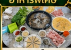
ชาปูเห็ด