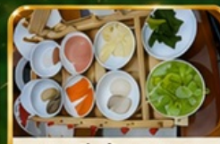
ซินมินข้ามสะพาน