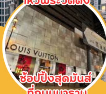
ช้อปปิ้งสุดมันส์ ที่ถนนคนตรา