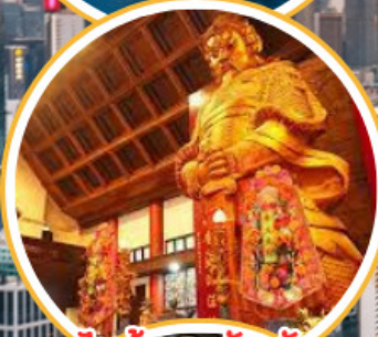
ไหว้พระวัดดัง