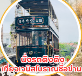
นั่งรถตติงตติง