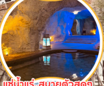
แช่น้ำแร่..สบายตัวสุดๆ