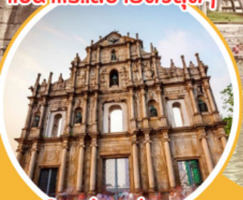
โบสถ์เซนต์พอล