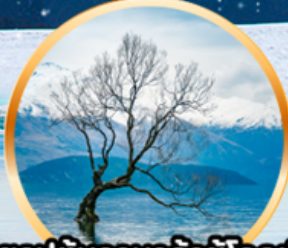
ถ่ายรูปต้นวานากาที่โดดเดี่ยว ที่ทะเลสาบวานากา