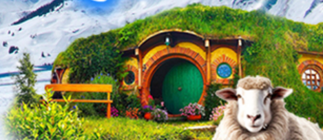
เยือนหมู่บ้านฮอบบิท แห่งลอร์ด ออฟ เดอะ ริงส์