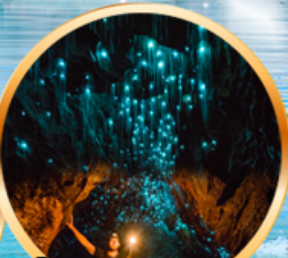
ดำหนอนเรืองแสง ไวท์โทบี

10 D | 22-31 ก.ค. 69 (วันเฉลิมฯ, อาสาพหุชา, เข้าพรรษา) 8 N | 08-17 ส.ค. 69 (วันแม่แห่งชาติ)