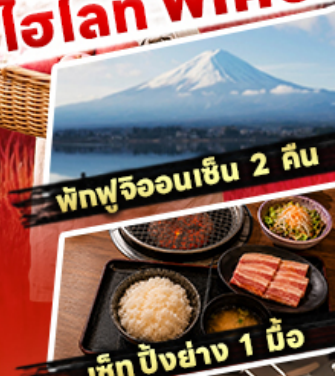
พิชฟูจิออนเซ็น 2 คืน