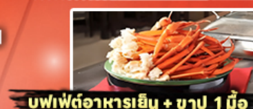
บุฟเฟ่ต์อาหารเย็น + ชาปู 1 มื้อ

ราคาเริ่มต้น 25,919 บาท รวมภาษีมูลค่าเพิ่ม 7%