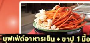
บุฟเฟต์อาหารเย็น + ชาบู 1 มื้อ

รหัสทัวร์ RJ-XJ134 เดินทาง 5D 3N ก.ย. - ต.ค. 2569