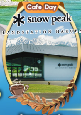
Snow Peak Land Hakuba