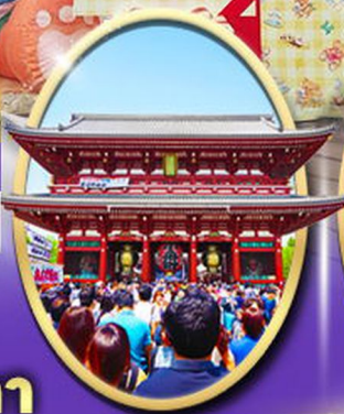
วัตเกาะซากุระ