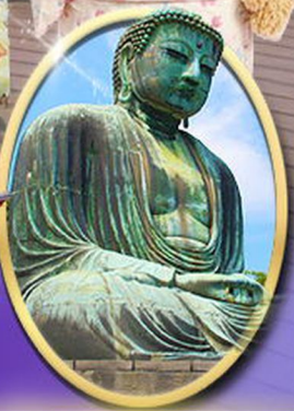
พระใหญ่คามาคูระ