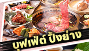
บุฟเฟต์ ปิ้งย่าง