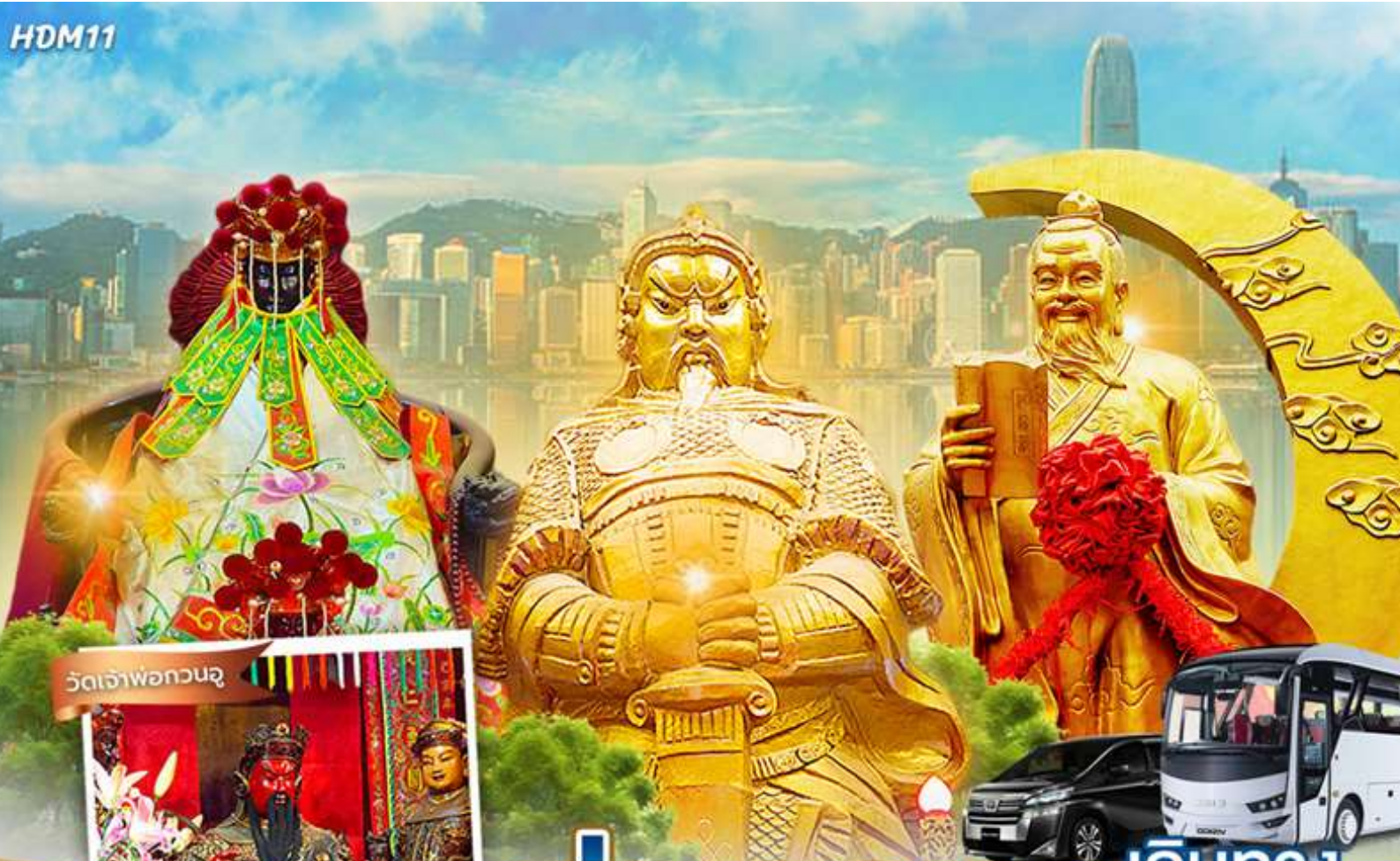
วัดเจ้าพ่อกวนอู