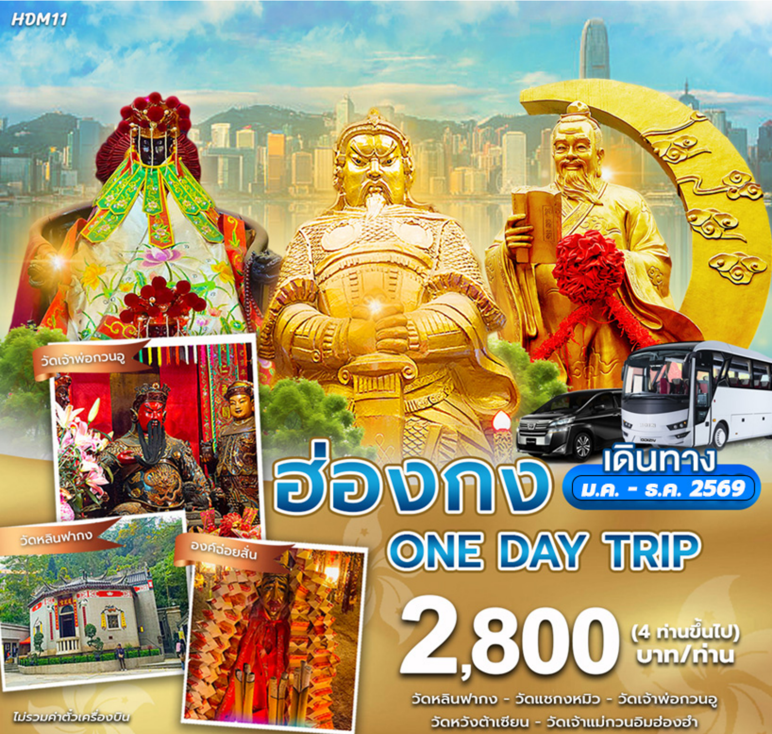
วัดเจ้าพ่อกวนอู