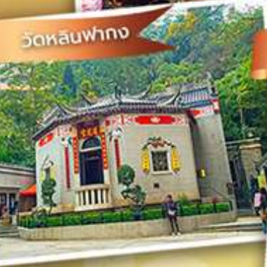
องค์อ้อยส้ม