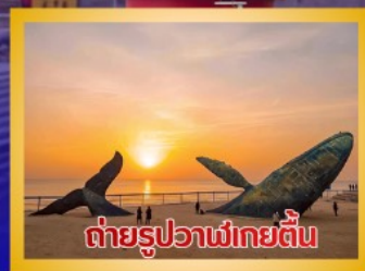
ต่ายรูปวาฬยักษ์

สะพานจันเจียว-โบสถ์คาทอลิกชิงเต่า (ชมภายนอก)-ป่าตึกวน- พิพิธภัณฑ์เบียร์ชิงเต่า -ถนนคนเดินโตตง -ผิงไห่เก้อ-ชายหาดและ จุดต่ายรูปปลาวาฬยักษ์ -ถนนจ้าววีป่าเจีย-ชายหาดลากวอไห่- จัตุรัสซิงฟู่หมิน-สวนเว่ยไห่ -สวนเยวี่ไห่-เกาะหยางหม่าย่าน - เมือง ท่าเหยียนไถ่-ท่าเรือชาวประมงเหยียนไถ่-ภูเขาเหยียนไถ่-จัตุรัส 54 -ศูนย์ โอลิมปิกเรือใบชิงเต่า-ภูเขาเหลาซาน-วัดไท่ซิงกง-สวนเสี่ยวม่วยเต่า ชายหาดทะเลหมายเลข 3-อาคารไห่เทียน ชั้น 81- Cyber Punk