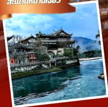
พิพิธภัณฑ์หออูรักซ์แพนด้า