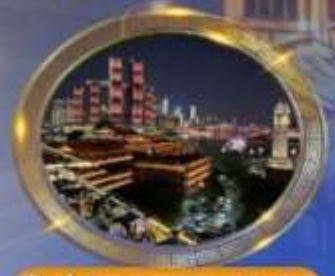
ช้อปปิ้งร้านอาหารรสหวงหลี่หลาน