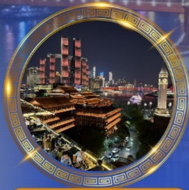
มื้อค่ำร้านอาหารวิสาหกิจ