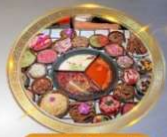
บุฟเฟต์หมีผิงไฟหลงชิ่ง