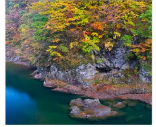
ชมเขาดากิไดริ