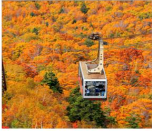
นั่งกระเช้าฮักโกดะ