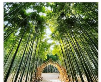
ป่าไผ่วากายามะ