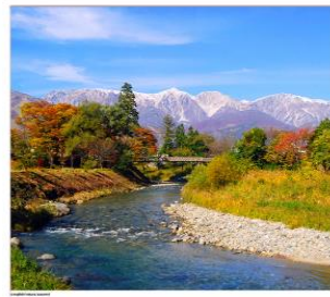
โออิเดะปาร์ค