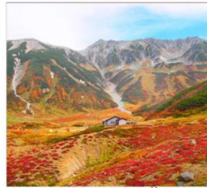
เส้นทางสายอัลไพน์ ทาเทยาม่า