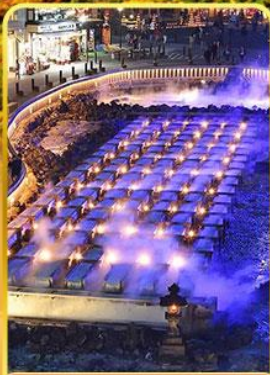
ชมยูบาตากะ