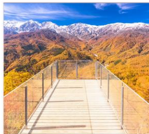
นั่งกระเช้าฮาคุมะ