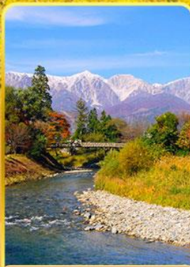
โออิเดะปาร์ค