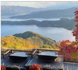
จุดชมวิวทะเลสาบทั้ง 5 ของมิกากะ