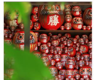
วัดคัตสึโองิ