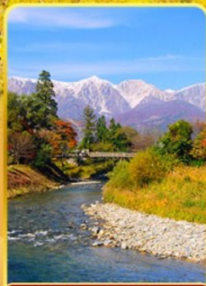
โออิเดะปาร์ค