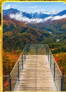
อาคุบะอิวาดากะ