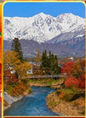
โออิเดะพาร์ค