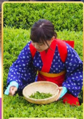
กิจกรรมเก็บบชา