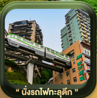
“ นั้งรถไฟทะลุตึก ”