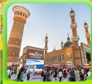
"ตลาดต้าปาจา"

รวมรถไฟความเร็วสูง 1 ขบวน (อ๋หนิง - อูรูมู่ฉี)