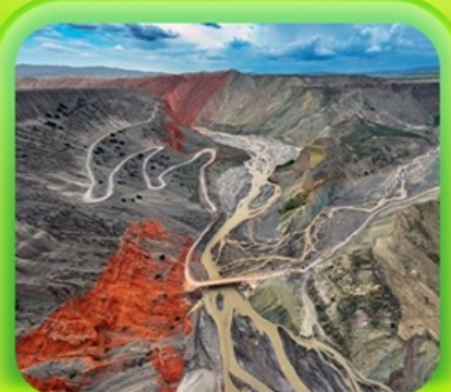
"แกรนด์แคนยอนคู่ชาวจื่อ"

ซินเจียงเหนือ ทะเลสาบไซลีมู่ "น้ำตาหยดสุดท้ายของแอตแลนติก" • ทุ่งหญ้านาราภิบาล ทุ่งดอกไม้เทียนซาน • ผ่านชมสะพานกั๋วจื่อโกว • ถนนหลิวซิงเจียง • ตลาดต้าปาจา