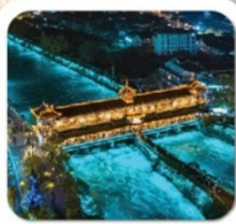
"สะพานหนานเจียว"