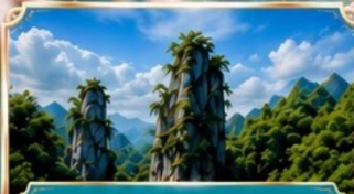
Enshi Puyan อุทยานหินเจินซือปู้หย่า