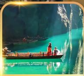
แกรนด์แคนยอนผิงชาน