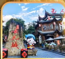
เมืองเทพริดาตุ๋เจีย