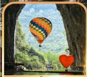
อุทยานถ้ำเกิงหลง