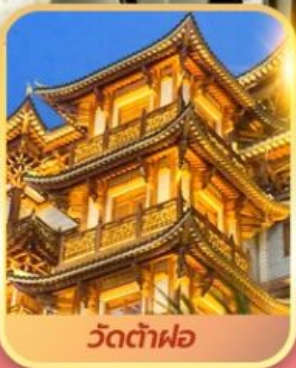
วัดต้าฝอ