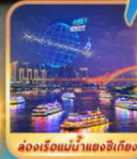
ล่องเรือแม่น้ำแยงซีเกียง