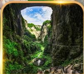
อุทยานหลุมฟ้า 3 สะพานสวรรค์