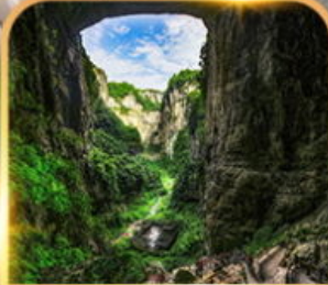
อุทยานหลุมฟ้า 3 สะพานสวรรค์