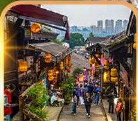
หมู่บ้านโบราณฉือซีโจว