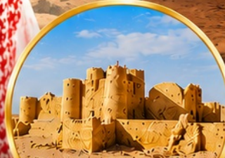
กลุ่มปราสาททะเลทราย (Desert Castles)