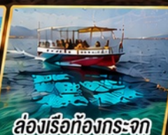
ล่องเรือท้องกระจก