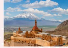
พระราชวังอิซฮาก พาชาร์

** พักที่ Kale Hotel 4* หรือเทียบเท่า **