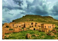
เมืองดารา

** พักที่ Kardelen Hotel 4* หรือเทียบเท่า **