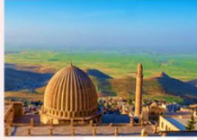
เมืองมาร์ดิน

** พักที่ Yay Grand Hotel 4* หรือเทียบเท่า **