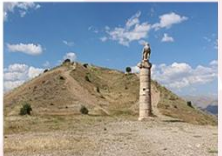
สุสานคาราคูซ

** พักที่ Nemrut Euphrat Hotel 4* หรือเทียบเท่า **