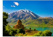
ปราสาทวาน

** พักที่ Reform Hotel 4* หรือเทียบเท่า **