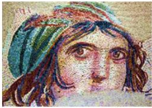
พิพิธภัณฑชุกมา โมเสก

** พักที่ Harran Hotel 5* หรือเทียบเท่า **