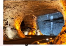
ถ้ำเกลือ

** พักที่ Kale Hotel 4* หรือเทียบเท่า **