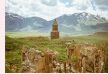
เมืองเอนิซม

15.40-18.10 น. ออกเดินทางสู่อิสตันบูล เที่ยวบิน TK2717