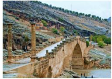
สะพานเซเวอร์ริน

** พักที่ Nemrut Euphrat Hotel 4* หรือเทียบเท่า **