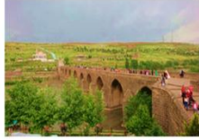
สะพานสิบโค้ง

** พักที่ Yay Grand Hotel 4* หรือเทียบเท่า **