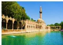
ถ้ำอับราฮัม