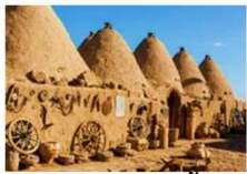
บ้านแบบรวงผึ้ง

** พักที่ Harran Hotel 5* หรือเทียบเท่า **