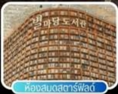
ห้องสมุดสตาร์พาร์ค